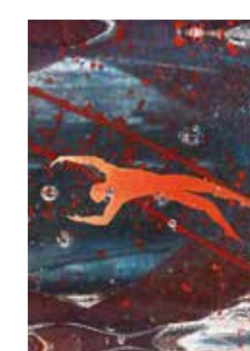
Varje båt är unik.

Ett av Bertil Valliens mest omtalade verk på senare tid heter Passage, eller The one million dollar boat som amerikanerna kallar den.