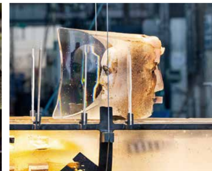
Bertil Valliens konstverk "Passage" med sina tre meter är Kosta Bodas dyraste verk hittills.