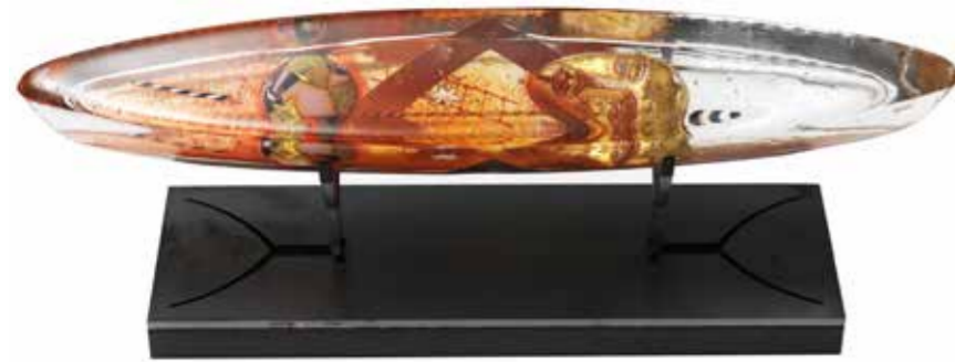
Viaggio Interiore skulptur röd ca 42 cm lång, 7 cm bred, 7 cm hög (14 cm inkl svart sockel) Pris: 24 000 kronor.