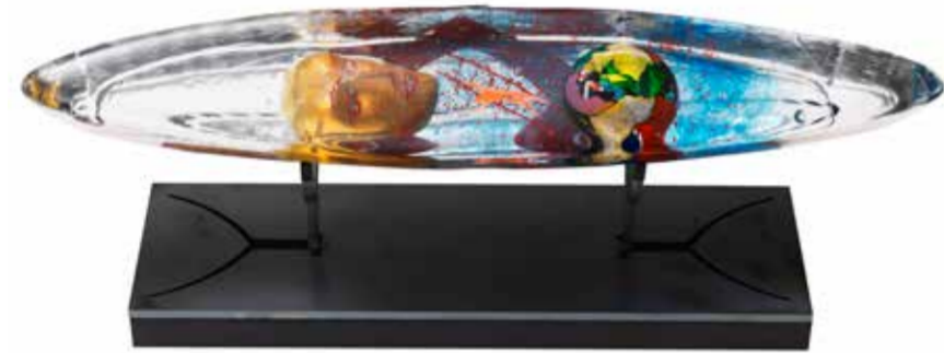
Viaggio Interiore skulptur blå ca 42 cm lång, 7 cm bred, 7 cm hög (14 cm inkl svart sockel) Pris: 24 000 kronor.