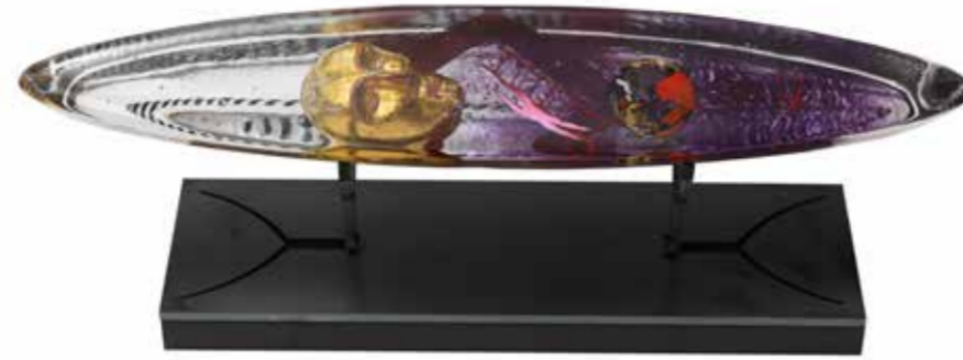
Viaggio Interiore skulptur lila ca 42 cm lång, 7 cm bred, 7 cm hög (14 cm inkl svart sockel) Pris: 24 000 kronor.