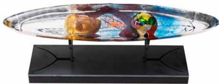
Viaggio Interiore skulptur blå ca 42 cm lång, 7 cm bred, 7 cm hög (14 cm inkl svart sockel) Pris: 24 000 kronor.

I ett unikt samarbete mellan konstnären och SvD accent är vi stolta över att presentera Bertil Valliens senaste konstverk, Viaggio Interiore, som betyder inre resa.