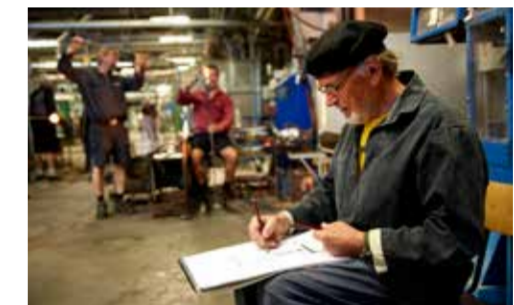
I hyttan gäller det att agera snabbt, glas är ett nyckfullt material och en del av processen lämnas alltid åt slumpen – hur noggranna förberedelserna än är.